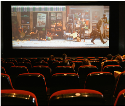
Cinéma Les Méliès