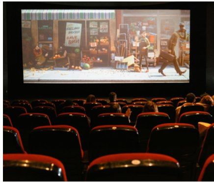
Cinéma Les Méliès