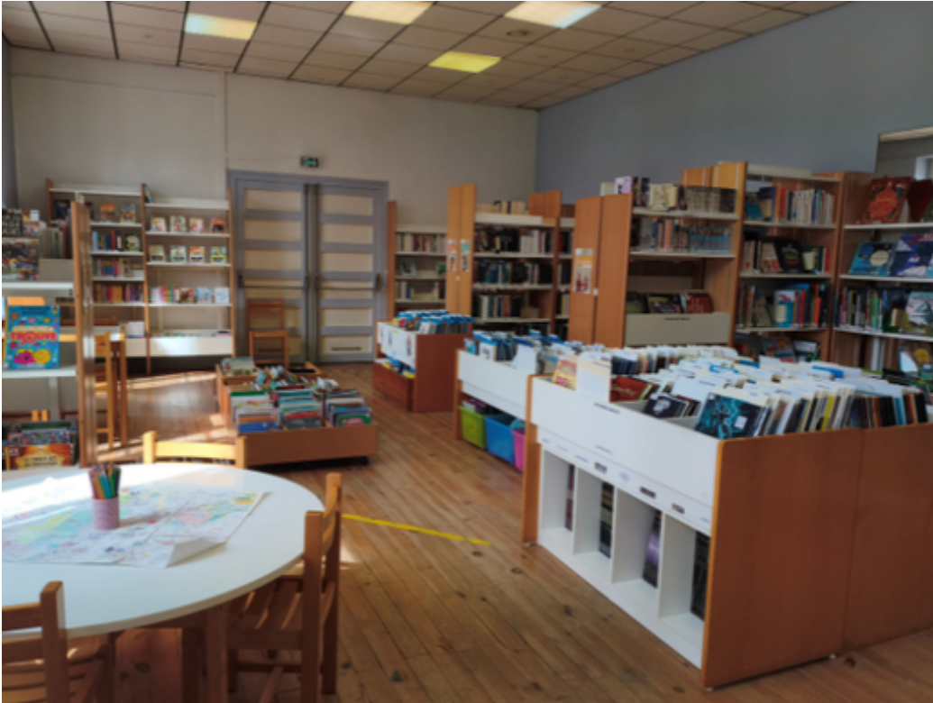
Médiathèque de Poliénas

Retrouvez dans cette rubrique toutes les informations pratiques sur les modalités d'inscription et les contacts utiles.